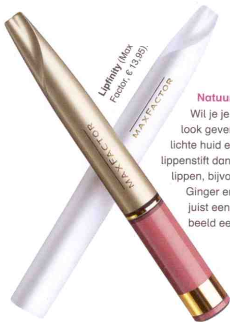
Lipfinity (Max Factor, € 13,95).