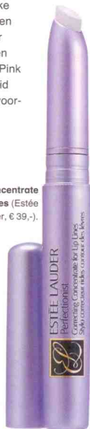
Correcting Concentrate for Lip Lines (Estée Lauder, € 39,-).

Wil je je lippen een natuurlijke look geven? Gebruik dan bij een lichte huid een nog lichtere kleur lippenstift dan de kleur van je eigen lippen, bijvoorbeeld de Lipfinity Pink Ginger en bij een donkere huid juist een donkerdere tint, bijvoorbeeld een chocoladekleur.