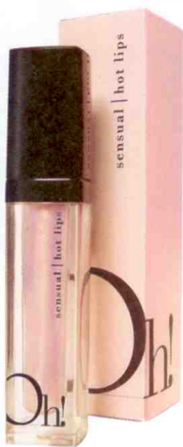
Hot Lips (Oh! Sensual, € 18,50).