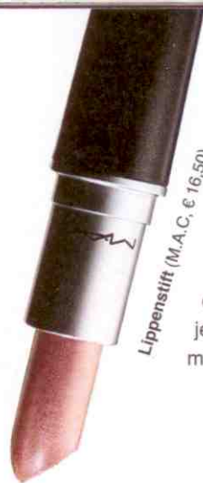
Lippenstift (M.A.C., € 16,50).