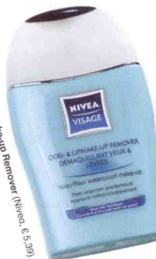
Oog- en Lipmake-up Remover (Nivea, € 5,39).

Gebruik voor 'kiss proof' lippenstiften een speciale reiniger, zoals de Oog- & Lipmake-up Remover (Nivea, € 5,39). Wrijf dit zachtjes over je lippen en verwijder met een wattenschijfje.